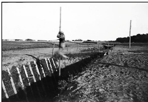
På flugt fra englænderne??

Graven der blev gravet var fire meter dyb og fire meter bred, og skulle standse en engelsk invasion, som man mente ville blive sat i land i det nordlige Vendsyssel. Den skar jo landet over i to dele, men vejene skulle dog stadig kunne befærdes, så der blev bygget en del broer, som var todelt med en buk under midten, som så kunne fjernes og broen ville falde sammen - hvis englænderne kom.