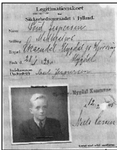
Mit legitimationskort fra 1945

Vi var stadig forskånet for egentlige krigshandlinger, men fulgte da med igennem radioen. I starten da tyskerne gik fremad var det den brovtende dansk - tysk censurerede presse, der fortalte om hvordan tyske ubåde sænkede det ene skib efter det andet, noget som jeg har beskrevet i min bog om ubådskrigen.