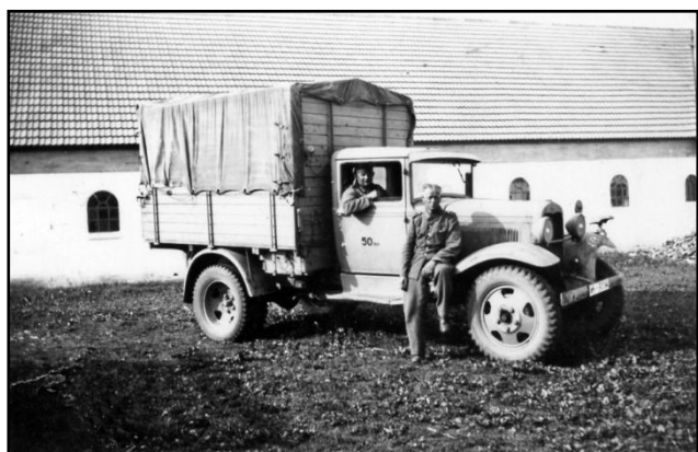
Tysk post placeret på "Skarndal´s" gårdsplads.

Efter krigen skulle alt dette jo fjernes igen, og det blev stort set de samme mennesker der kom for at jævne det hele ud. Både etableringen og den senere fjernelse skulle jo betales, rent formeldt var det tyskerne der betalte, men pengene tog de af den danske statskasse.