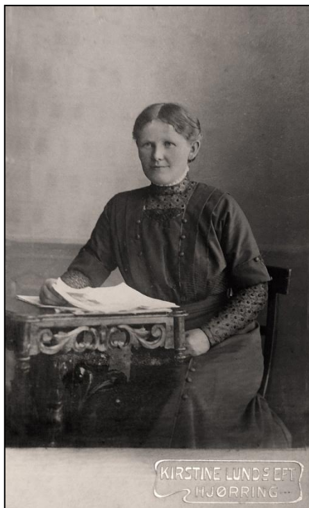
Portrætfotografiet er fra 1910