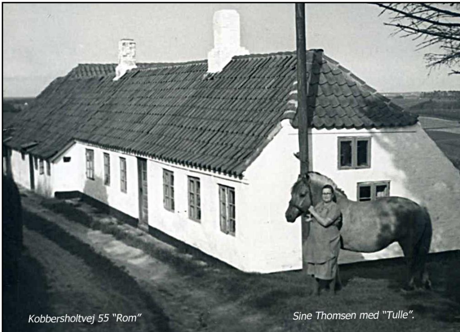
Kobbersholtvej 55 "Rom"