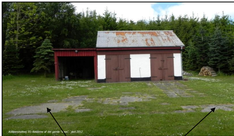
Kobbersholtvej 55- Resterne af det gamle "rom". Jerni 2012.

Indgangssten Det "gamle" Rom var placeret her.