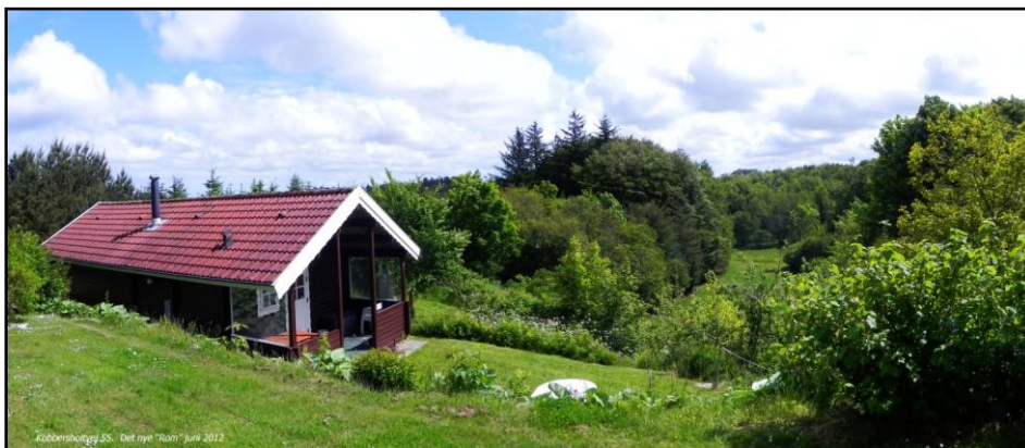
Kobbersholtvej 55. Det nye "Rom" juni 2012.

Indgangssten Det "gamle" Rom var placeret her.