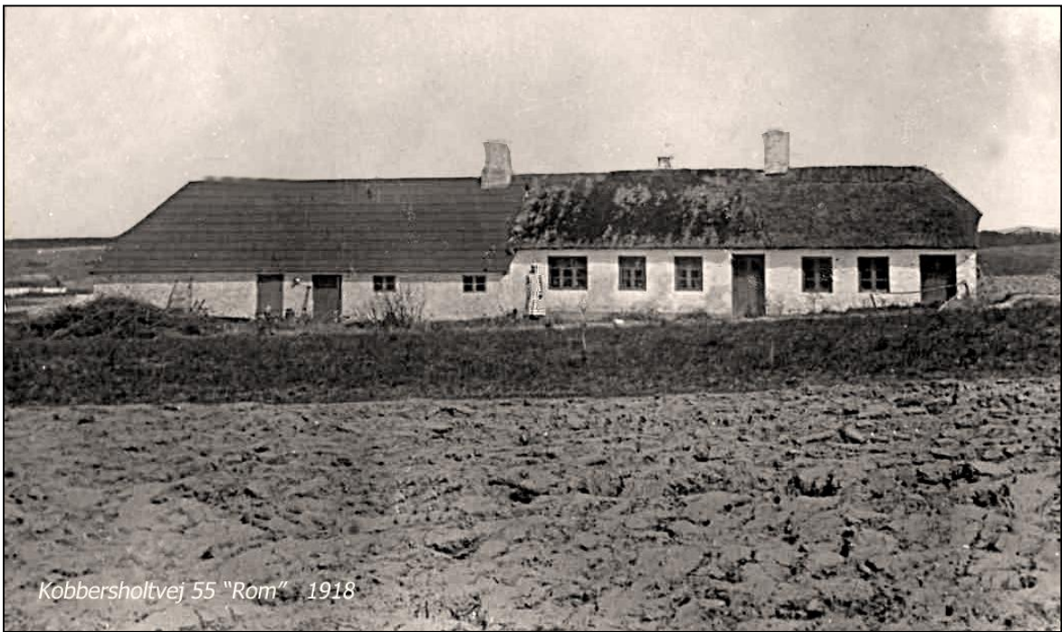
Kobbersholtvej 55 "Rom" 1918