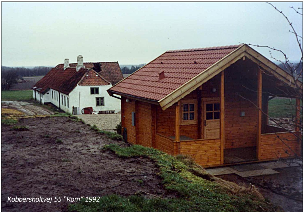
Kobbersholtvej 55 "Rom" 1992