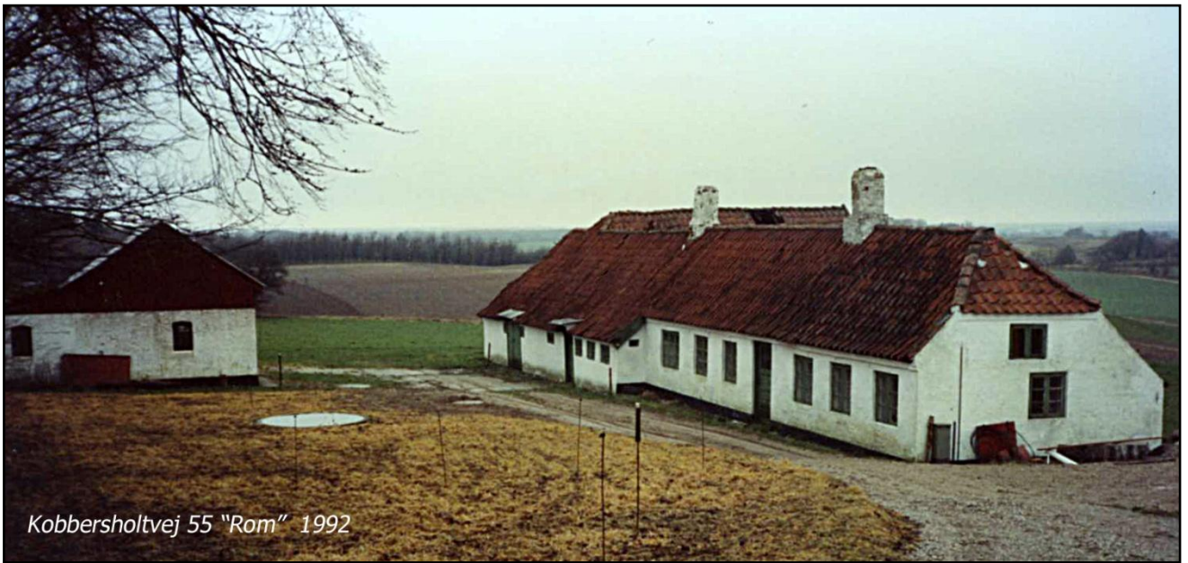
Kobbersholtvej 55 "Rom" 1992