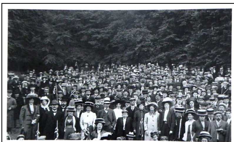
Fra et Slotvedmøde.