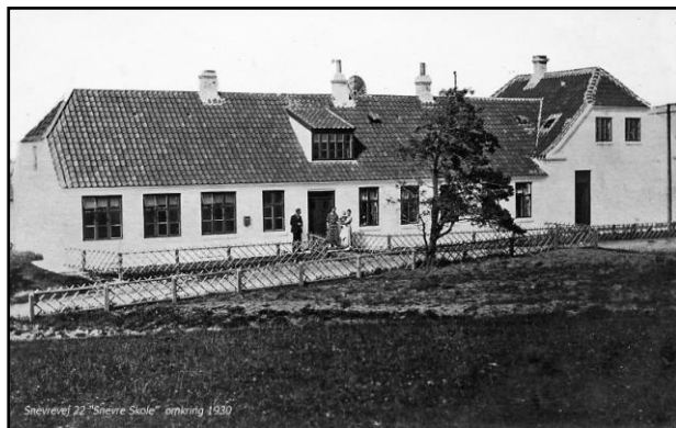
Snevre Skole som den så ud efter udbygningen.