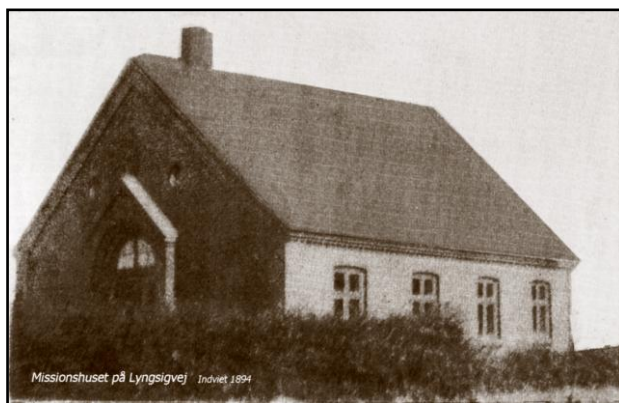
Missionshuset på Lyngsigvej.

At hans patriarkalske livssyn af og til var særdeles synligt, illustreres meget godt af den efterfølgende lille historie: