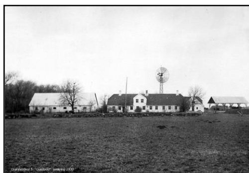
"Grøntved" omkring 1920