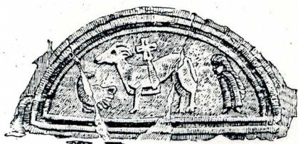
TYPANON OVER BJERGBY KIRKES TILMUREDE SYDDØR.

Fra midt i 1100-tallet og ca. hundrede år frem blev der i Danmark opført ca. 1500 sognekirker i granitkvadre. Af disse mange kirker er langt de fleste bevaret frem til vor tid. Tidligere havde man bygget i træ, men med opdagelsen af en ny byggeteknik hvor man sammenbandt store granitkvadre ved hjælp af mørtel, havde man fået et næsten uforgængeligt murværk. Kirkerne var enkle i udformningen. De bestod som regel kun af to rum, et skib og et kor. Næsten alle er blevet ændret i tidens løb ved om- eller tilbygninger. Langt de fleste har fået større vinduer og mange er blevet udvidet med tårne, våbenhuse o.s.v. De er alle en del af vor nationale arv og de har i over 800 år sat præg på vort kulturlandskab.