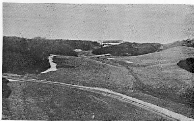
-Dal i Bjergby ca. 1911