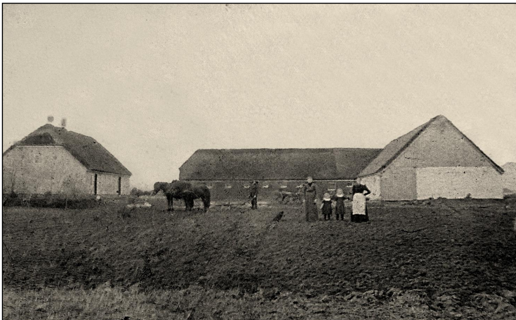
"Stenshede" i 1902.