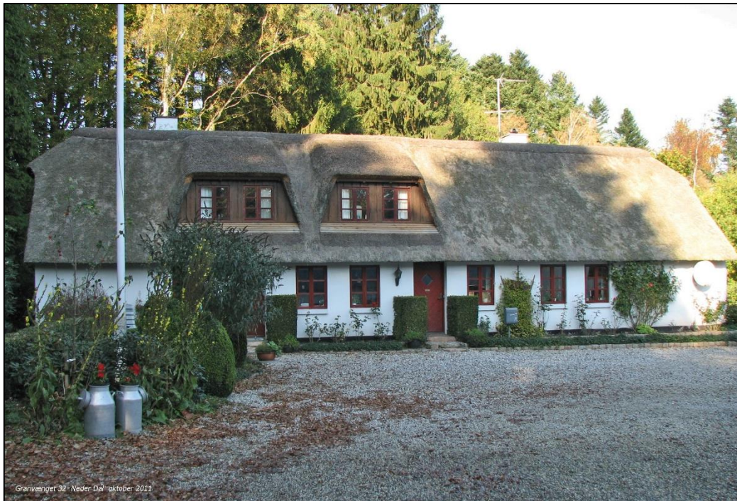
Granwegget 32 - Neder-Dal oktober 2011