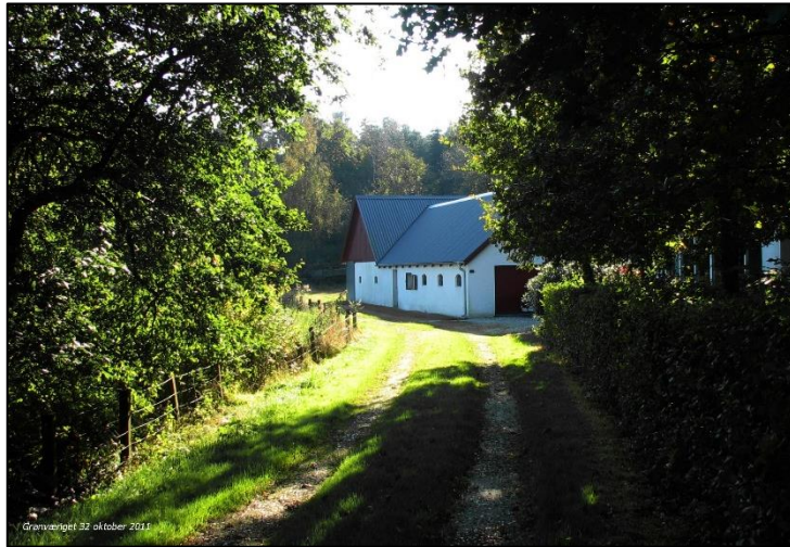
Granwegget 32 oktober 2011