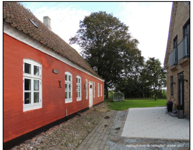
Holtegårdsvej 76 "Holtegård" oktober 2012