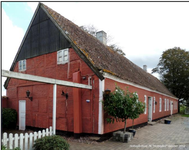
Holtegårdsvej 76 "Holtegård" oktober 2012