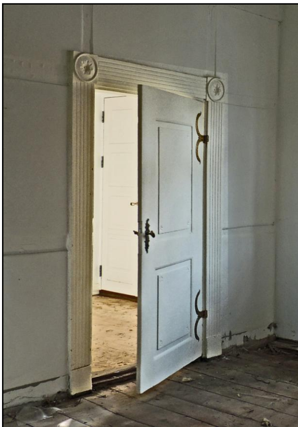
Fornemme døre og dørkarme.