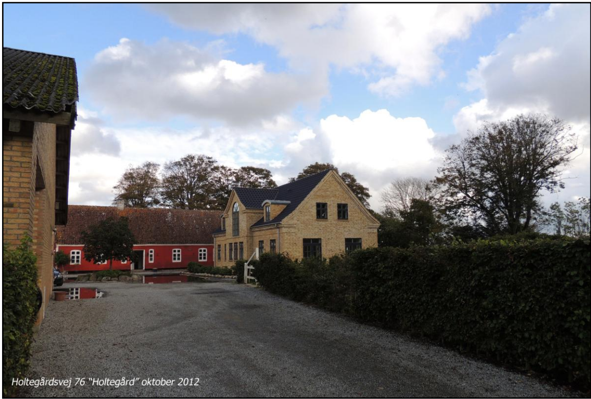
Holtegårdsvej 76 "Holtegård" oktober 2012