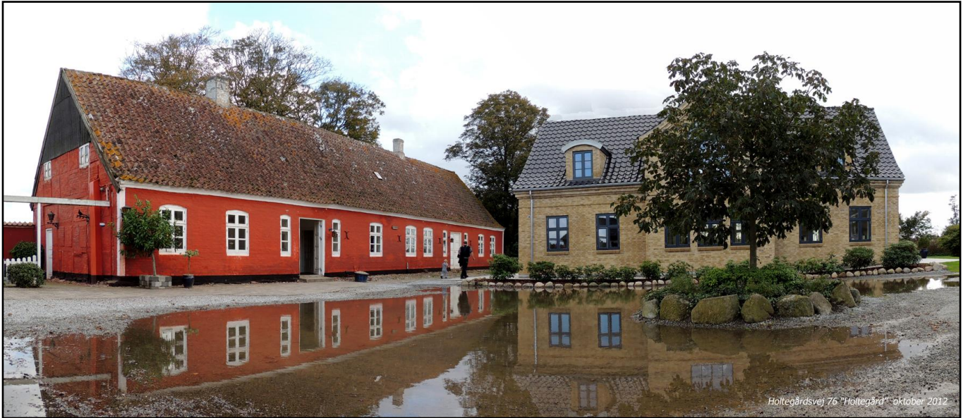
Holtegårdsvej 76 "Holtegård" oktober 2012