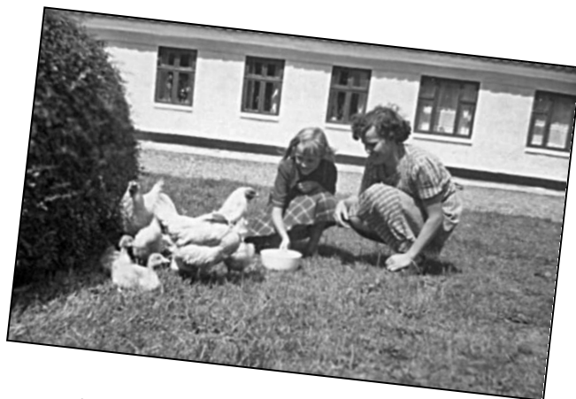
Glimt af hverdagslivet på "Saxtrupgård" i 1940erne.