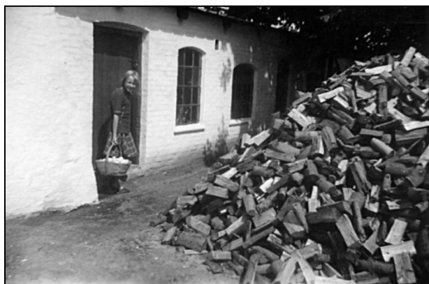
Den lettiske pige Inare henter æg. Stakken af kløvede pinde, der er næsten to meter høj og 8-10 meter lang, er lavet af Berthin.