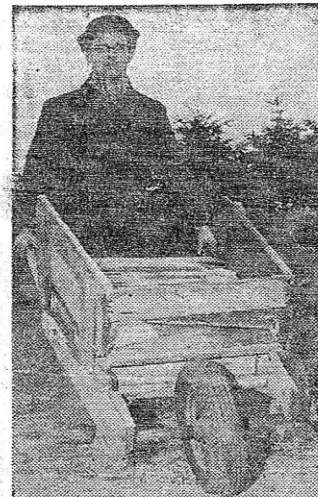
Trillebøren er spækket med søm.

— Det var strengt? — Nej, det var tværtimod sundt med den motion. Jeg maatte tidligere opgave mekanikerfaget, fordi jeg ikke kunne taale at ligge og rode paa jorden inde under vogne. Det blev mig for koldt, jeg fik gigt og muskelinfiltrationer. Nu arbejder jeg med installering af centralvarme, det er lunere. De stive, kolde